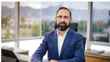
Andrés Camacho, ministro de Minas y Energía.

Forbes Staff | septiembre 18, 2024 @ 10:09:26 am