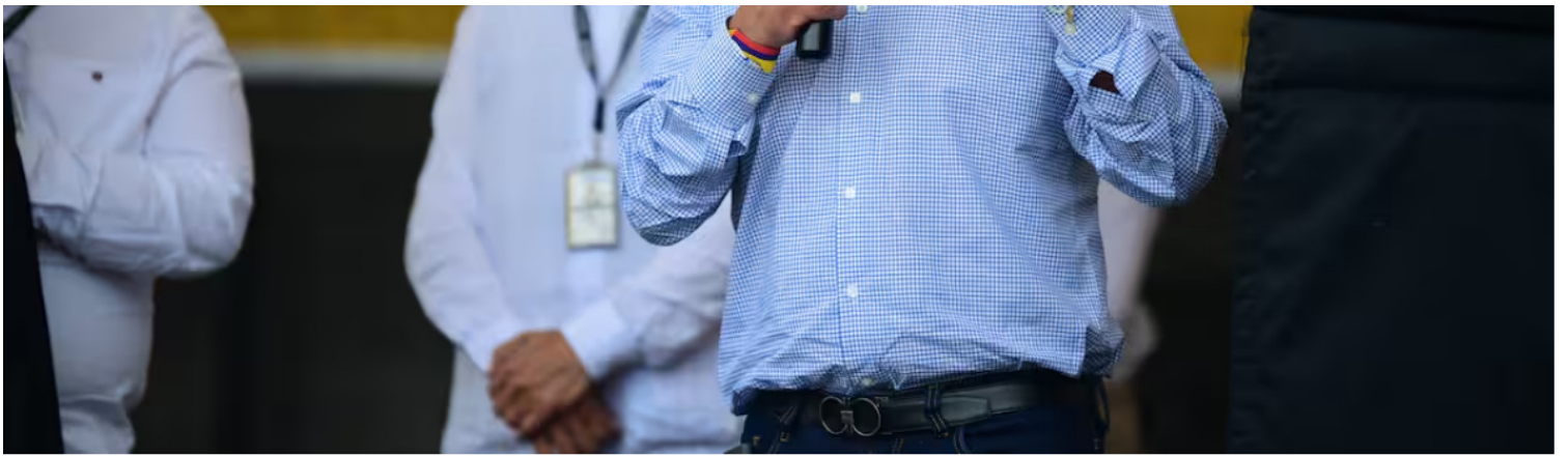
Candidato a la presidencia de Colombia durante su visita a Fusagasugá