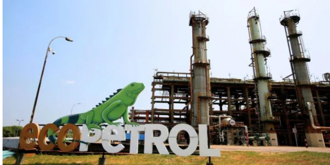
Procuraduría pretende desbloquear proyecto de Ecopetrol.

La Procuraduría pretende la revocatoria de la suspensión del trámite de la licencia para la perforación de un pozo por parte de Ecopetrol.