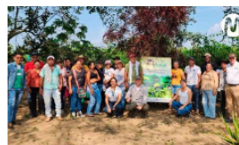
Gobernación del Meta impulsa prácticas de ganadería sostenible