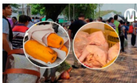
Más de $28 millones en ventas deja el segundo 'Mercado Camesino Express'