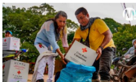
Entregan ayuda humanitaria a damnificados por las lluvias en el Meta