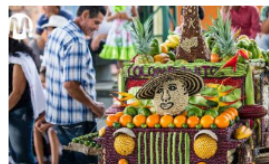
Carretilleros de Lejanías son declarados Patrimonio Cultural Inmaterial de la Nación