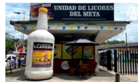
Reactivan punto de venta de Aguardiente Llanero en la Unidad de Licores del Meta