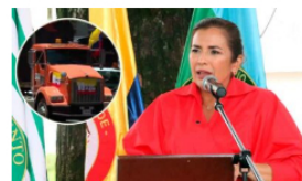
Paro de transportadores podría desatar un problema social: gobernadora del Meta