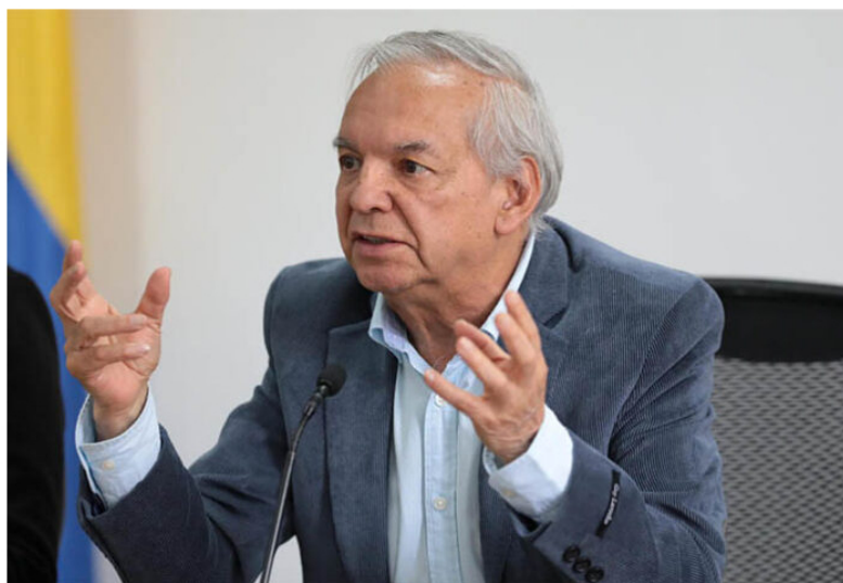
Ricardo Bonilla, ministro de Hacienda.