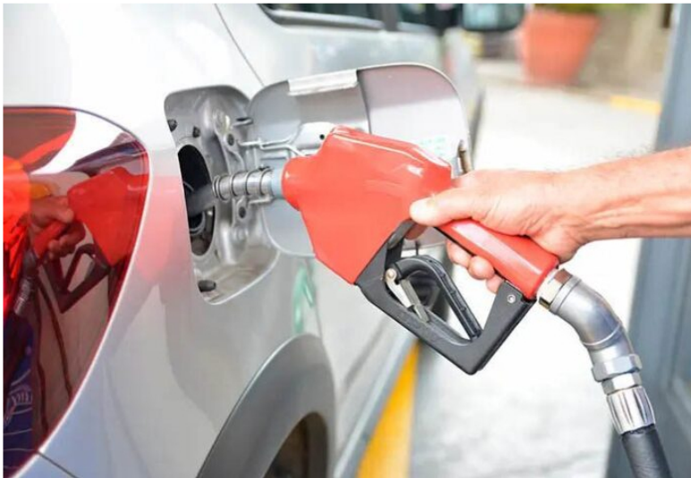
Con esta propuesta, el precio del galón promedio de la gasolina pasaría de $15.881 a $16.306; mientras que el diésel se incrementaría desde $9.711 hasta $10.199.