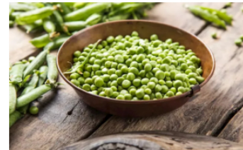
¿Se dice alverja, arveja o arverja? Escritura y pronunciación correcta según la RAE