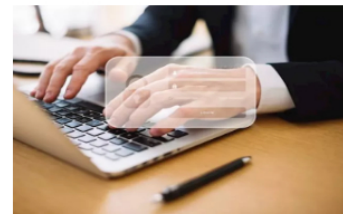
Expertos piden blindar a las pymes de amenazas cibernéticas