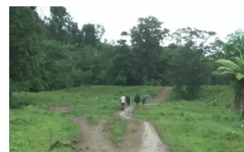
Alarmante informe de Human Rights Watch sobre la situación de los migrantes que cruzan el Darién