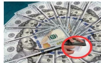
Cuánto son 15, 20 o 30 dólares en pesos colombianos: Costo según variación del dólar