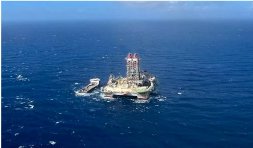
Caribe Colombiano, Pueblo Indígena Taganga, Ecopetrol Y Petrobras