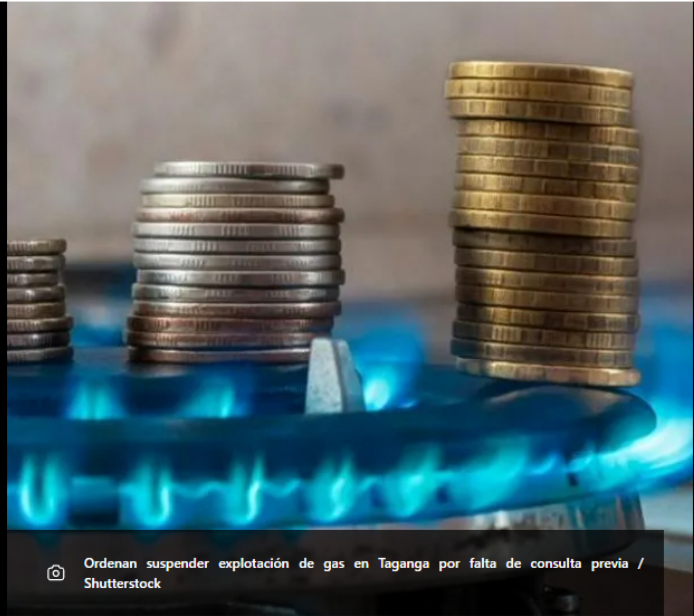
Ordenan suspender explotación de gas en Taganga por falta de consulta previa