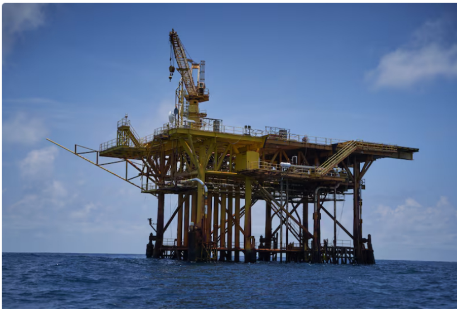
Ordenan a Ecopetrol y Petrobras detener la perforación de un pozo de gas clave en alta mar

A punto de enfrentarse a un déficit de gas natural a principios del próximo año, las esperanzas de Colombia dependen del futuro potencial de sus pozos en aguas profundas