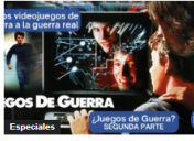
Espectáculos (ESPECIAL) De los videojuegos de guerra a la guerra real: "Juegos de Guerra" La película predictiva de la guerra moderna