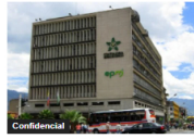
Confidencial (CONFIDENCIAL) Contraloría Distrital de Medellín tiene un déficit de $3.800 millones en cesantías