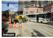
Antioquia Se los tragó la tierra... a vehículos en Bello