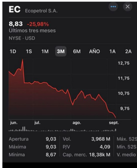
Comportamiento de acciones en bolsa