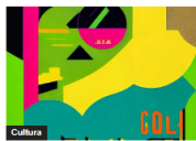
Cultura Jorge Zapata: "las realidades paralelas virtuales están transformando la forma en que experimentamos el arte"