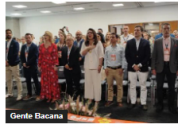
Gente Bacana Medellín abrió sus puertas a Colombia Travel Expo 2024