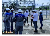
Colombia No habrá apagón en la costa Caribe tras intervención de Air-e: Agente interventor