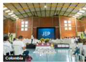
Colombia Denuncian incoherencias en la JEP sobre casos de falsos positivos