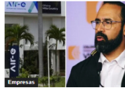
Empresas Air-e colaborará en la intervención y espera resolución sobre acuerdo temporal para evitar crisis energética