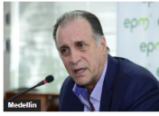
Medellín EPM confirma disposición de vender acciones de AFINIA al Gobierno