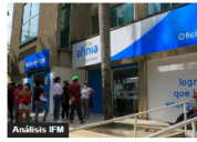
Análisis IFM (ANÁLISIS) El caso AFINIA: un mal negocio desde el principio