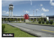
Medellín Cierre Programado del Aeropuerto José María Córdova por Mantenimiento en Pista