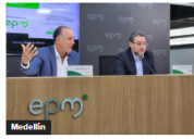
Medellín EPM alerta sobre crisis de AFINIA y pide apoyo al Gobierno para evitar impacto en la costa Caribe