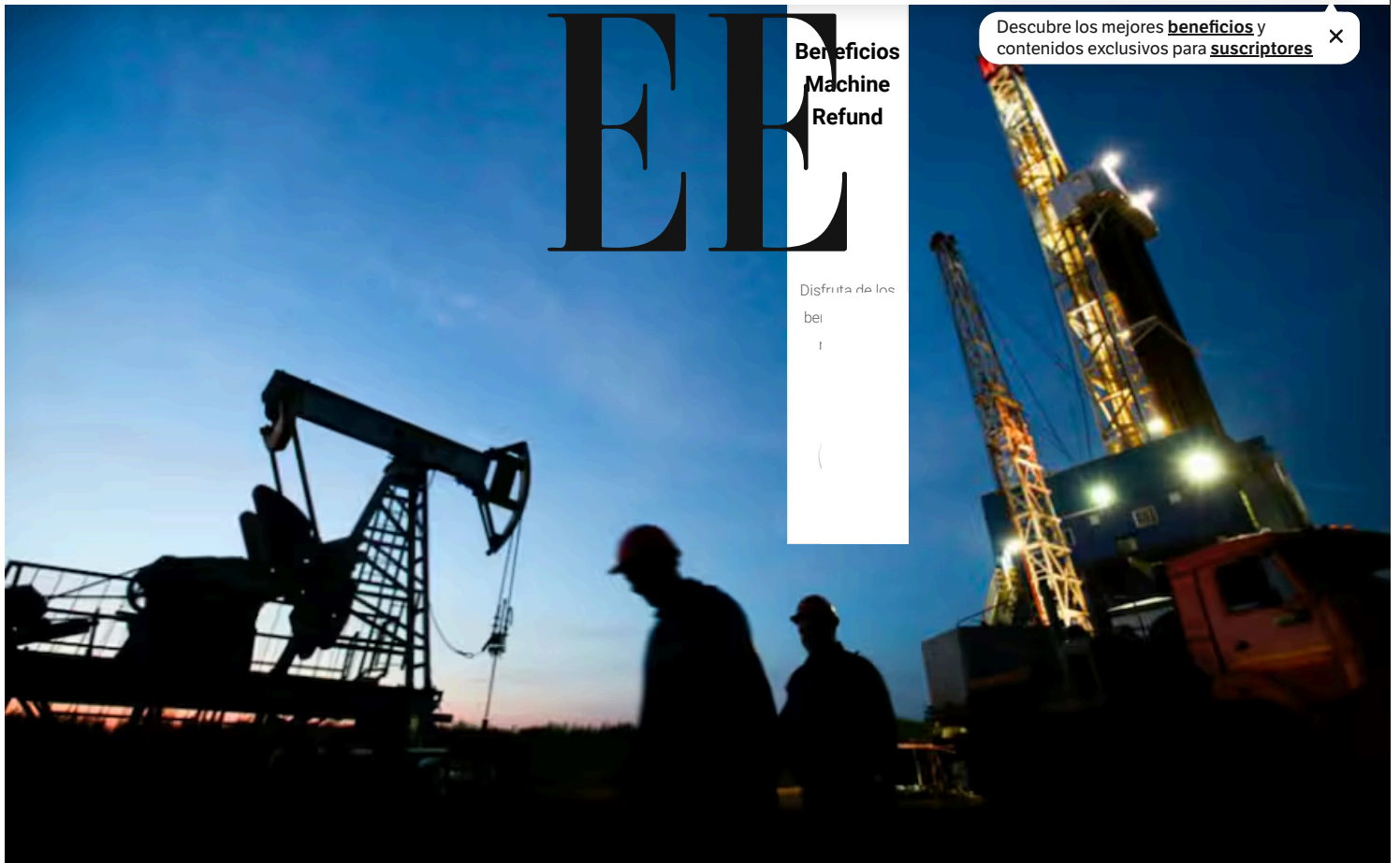
Imagen de referencia.