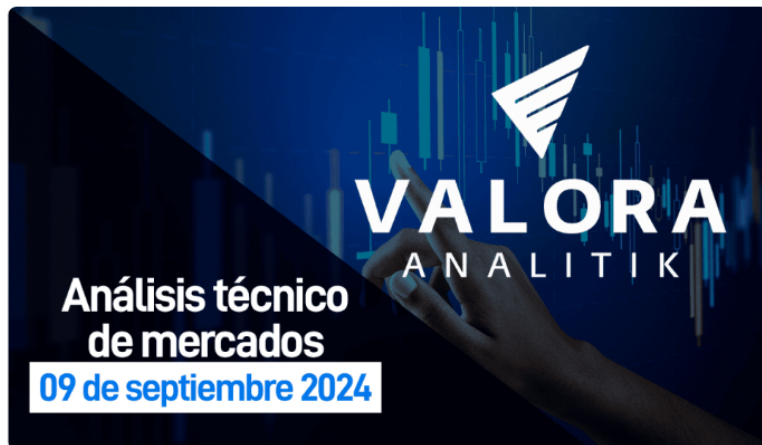
Canacol Energy y Ecopetrol las que más cayeron en la semana.

El índice MSCI Colcap de la bolsa de valores de Colombia cierra la semana en 1.328,47 puntos registrando al cierre del día viernes una variación negativa para este periodo de tiempo de -2.48 %, perdiendo toda la subida de la semana anterior. El índice para lo corrido del año presenta una variación positiva (YDT) + 11.15%.