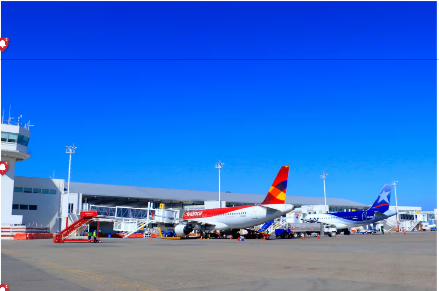
Aeropuerto Internacional Rafael Núñez.

La empresa de combustible Terpel emitió un comunicado anunciando a cuatro ciudades del país afectadas. Esto dice el Aeropuerto de Cartagena.