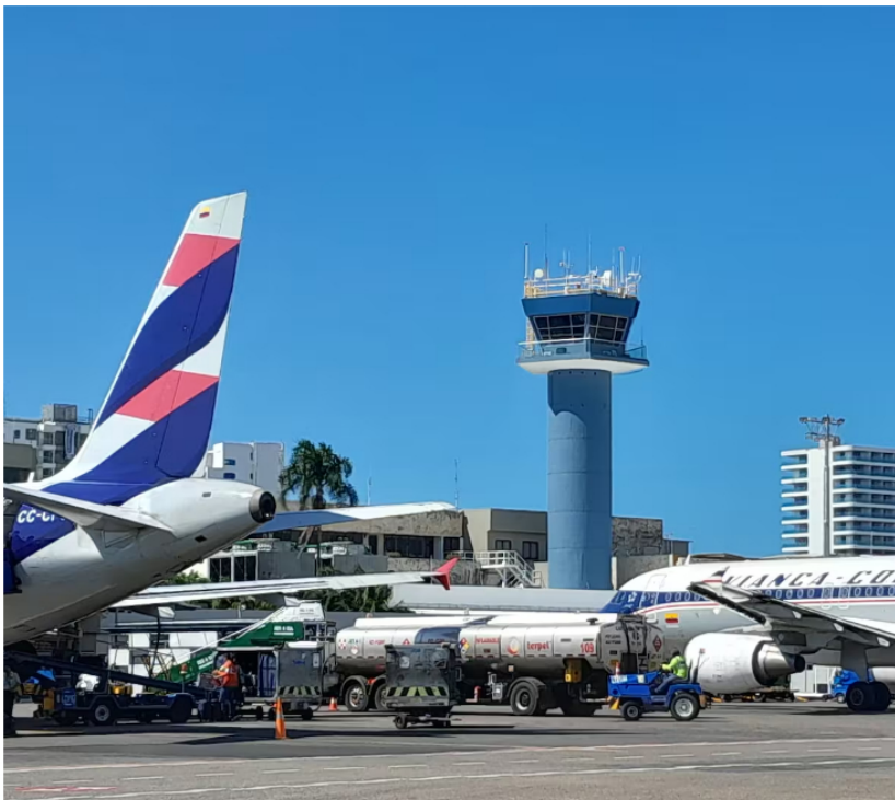
Abastecimiento de combustible a aeronaves en el Aeropuerto Internacional Rafael Núñez, de Cartagena.

El Universal contactó a una fuente que señaló que el Aeropuerto Rafael Núñez sigue operando con normalidad, aunque están atentos a los pronunciamientos oficiales de las autoridades gubernamentales y de Terpel.