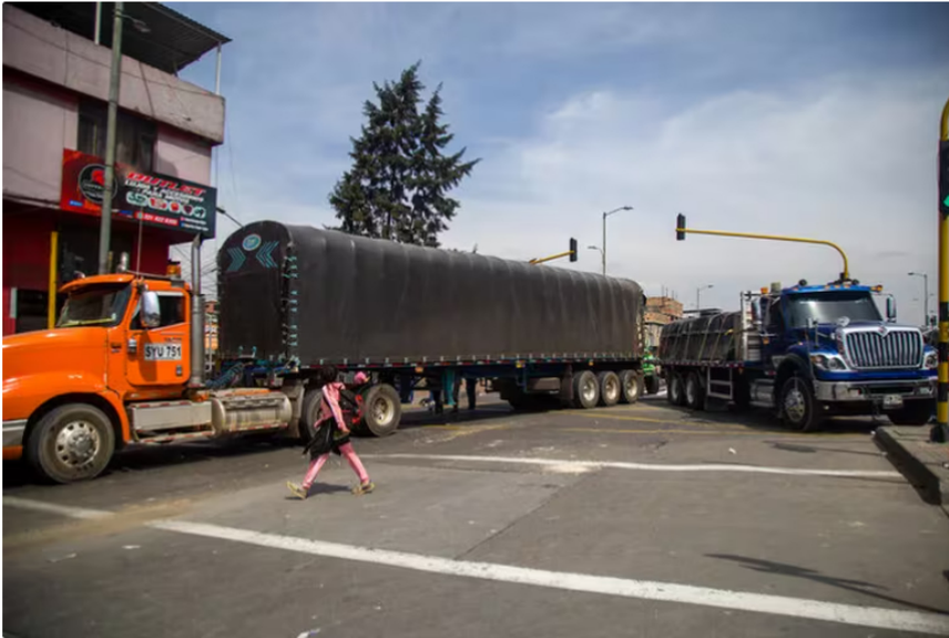
El paro camionero acumula cuatro días y ya generó afectaciones económicas de todo tipo

En las próximas horas, por esta misma situación, quedarán apagados los campos Llanos Norte, (Arauca) y Tisquirama, San Roque y Aullador, ubicados en el Magdalena Medio, así como el Clúster 25-Nueva Esperanza (Meta).