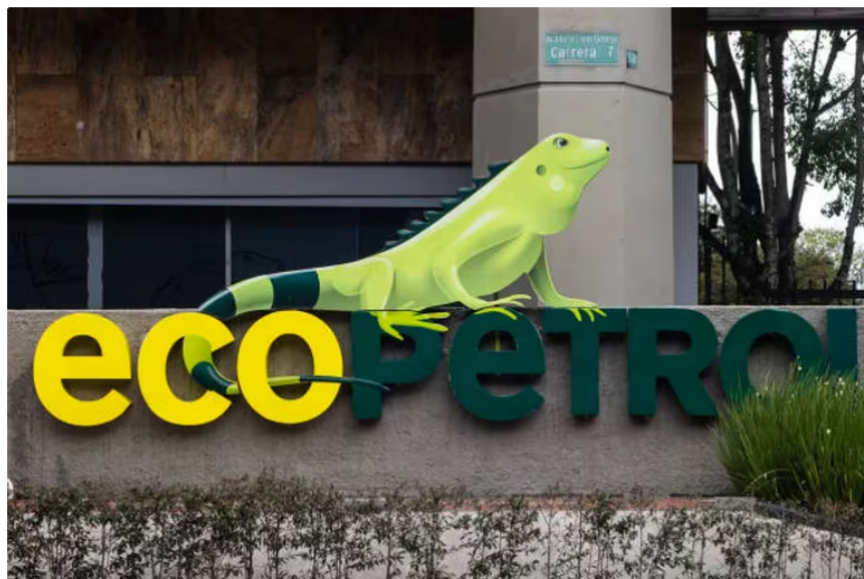
De Ecopetrol dependen gran parte de la economía colombiana

Ecopetrol informó que inició el apagado de campos de producción de petróleo debido a la situación de bloqueos en las vías a causa del paro camionero que se hace contra el aumento del precio del galón de Acpm, que impide el normal desarrollo de sus operaciones en distintos lugares del país.