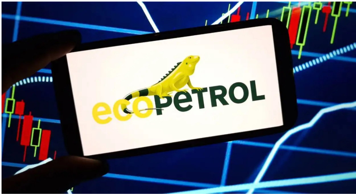
Ecopetrol detiene producción de hidrocarburos por bloqueos viales.

Sobre las 3:00 de la tarde de este 05 de septiembre de 2024, la empresa petrolera estatal Ecopetrol informó a través de un comunicado de prensa en redes sociales, que han comenzado a apagar sus campos de producción de petróleo debido a los múltiples bloqueos en las vías causados por el paro de camioneros.