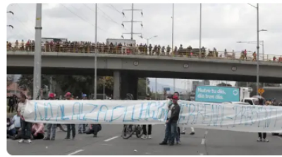
Así está la movilidad en Bogotá por paro camionero hoy, 5 de septiembre