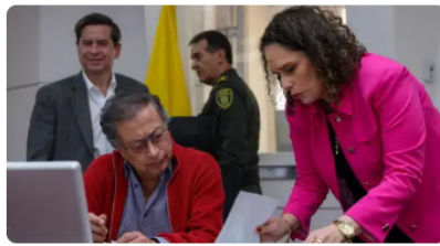
"Hemos llegado al límite": MinInterior sobre sus propuestas a camioneros