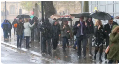
IDEAM confirmó el clima que habrá en Colombia este mes