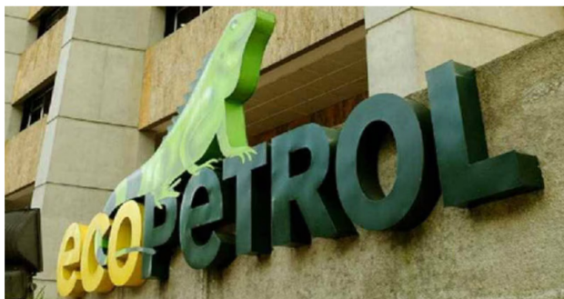
Esta situación mantiene en alerta a las autoridades.

Este es el segundo ataque al Oleoducto Caño Limón Coveñas que se registra en menos de 24 horas, el primero ocurrió el pasado martes también en el departamento de Boyacá, pero fue en La Cañaguata KP111+800, Cubará.