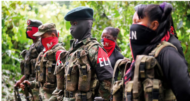
Detrás de los ataques estarían integrantes del ELN.

La situación mantiene en alerta al Grupo Ecopetrol, indicaron que desde finales del mes de agosto del presente año se han registrado 15 atentados en contra de la infraestructura de transporte de hidrocarburos en esta zona del país.