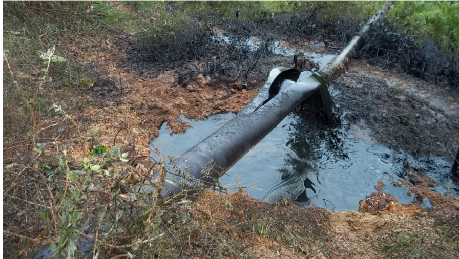
La situación mantiene en alerta a las autoridades.

Un nuevo atentado se perpetró contra el Oleoducto Caño Limón Coveñas, según denunció en la tarde de este miércoles, 4 de septiembre, Cenit, filial del Grupo Ecopetrol. A través de un comunicado, precisaron que el hecho ocurrió a la altura de la vereda Campo Alicia, Municipio de Cubará, en el departamento de Boyacá.