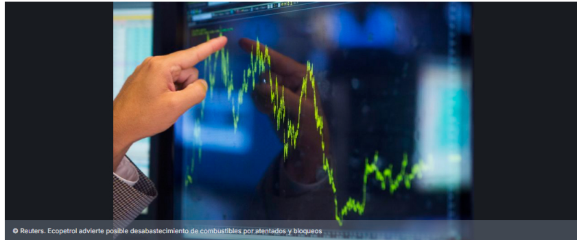
Ecopetrol advierte posible desabastecimiento de combustibles por atentados y bloqueos