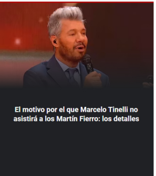
El motivo por el que Marcelo Tinelli no asistirá a los Martín Fierro: los detalles

Cayó una banda extorsiva: contactaban a sus víctimas por Tinder, se hacían pasar por policías y exigían dinero por una falsa causa