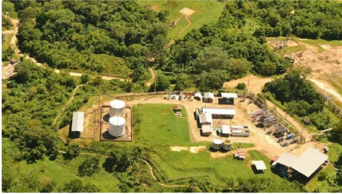
Indígenas u'wa se tomaron la planta de gas de Gibraltar, en Antioquia

Desde el inicio de los bloqueos, cinco municipios de Norte de Santander y la metropolitana de Bucaramanga han visto interrumpido el suministro de gas, situación que ha provocado preocupación por la seguridad de la planta.