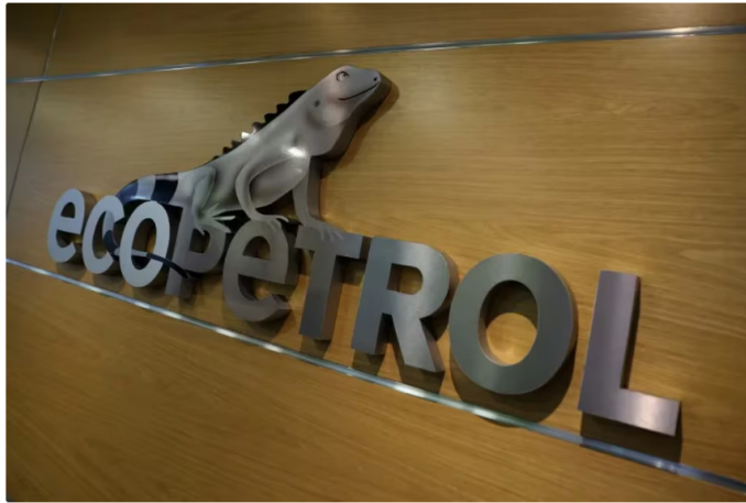
Ecopetrol se ha visto afectada por los recientes ataques a oleoductos y el paro camionero

Los recientes atentados contra los oleoductos Caño Limón Coveñas y Bicentenario, sumados a los bloqueos por el paro de transportadores y la toma de la planta de gas en Gibraltar, han generado restricciones en las operaciones de Ecopetrol.