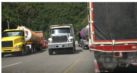
Ecopetrol informa que, debido a los atentados contra los oleoductos y los bloqueos por el paro de transportadores, sus operaciones se comienzan a ver afectadas por la imposibilidad de evacuar los hidrocarburos.

Las razones que aduce la empresa son que ha habido múltiples atentados contra los oleoductos Caño Limón Coveñas y Bicentenario, además de la toma de la planta de gas de Gibraltar; por otro lado, sostienen que los bloqueos producto del paro camionero afectan la distribución de combustibles .