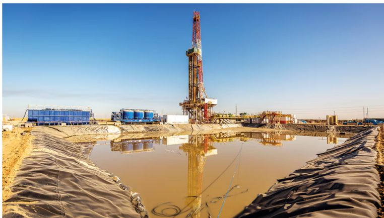
Las razones que aduce la empresa, es que debido a los múltiples atentados contra los oleoductos Caño Limón Coveñas y Bicentenario, que se han recibido en los últimos días, han afectado tanto la producción como la evacuación de hidrocarburos.

4 de septiembre de 2024 Por: Redacción El País