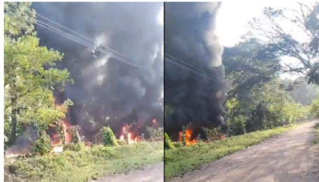
El atentado se registró este jueves.

De esta manera, aunque las autoridades no se han pronunciado frente a posibles víctimas mortales, el daño ambiental es muy significativo , ya que en los videos que se viralizaron en redes sociales se puede observar una gran columna de humo negro y gran cantidad de hidrocarburo regado en el suelo, por lo que la limpieza del área será un arduo trabajo.