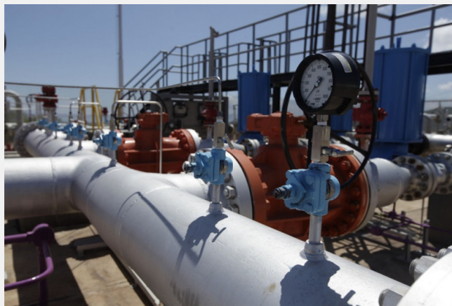
Producción de gas.

"El plan de contingencia de Ecopetrol se ha enfocado en mantener los niveles de producción de crudo y gas, las cargas a las refinerías y el despacho de combustibles y productos industriales y petroquímicos, en línea con el plan operativo", puntualiza Ecopetrol.