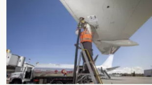
Paro camionero: Terpel advierte desabastecimiento de combustible para avión por bloqueos