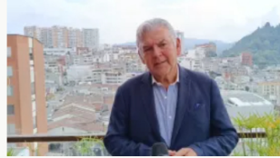
Paro camionero: "Pérdidas por bloqueos pueden llegar a unos $240.000 millones diarios", Fenalco