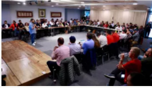
Paro camionero: Gobierno y transportadores no logran acuerdo