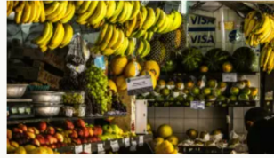
Paro camionero: MinAgricultura activa plan de emergencia para abastecimiento de alimentos