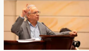
Caso UNGRD: lista la fecha para debate de moción de censura contra ministro Ricardo Bonilla