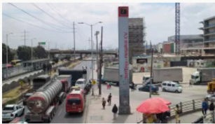
Paro camionero: Bogotá registra 25 afectaciones viales