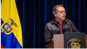
Presidente Petro acusa al gobierno Duque de adquirir el software Pegasus para espionaje