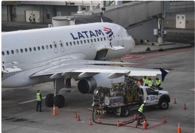
Los barriles importados se suman a la producción nacional, en las refineras de Cartagena y Barrancabermeja. Según Ecopetrol , en ambas refineras la producción está en niveles normales. Imagen de referencia.

De acuerdo con la petrolera, esto permitirá atender la demanda de combustible para avión en los próximos meses, tras la contingencia que llevó a que en varios aeropuertos del país escaseara el jet A1 y algunas aerolíneas cambiarán itinerarios de vuelo.