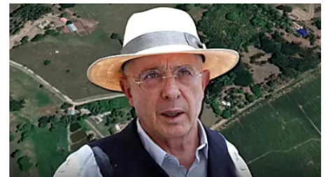
El Ubérrimo: Historia y misterios de la finca de Álvaro Uribe Vélez