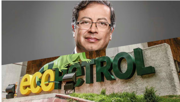
Desde el alto Gobierno, en la administración del presidente Gustavo Petro, no se dio el aval a la realización de un nuevo negocio de Ecopetrol con la OXY en el Permian.