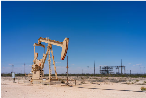
La operación de Ecopetrol en el Permian le ha servido para aumentar su producción total, mientras la del país está cayendo.

Y, precisamente, este resultado y el impulso de esa operación contrasta con la negativa de Ecopetrol de avanzar en el Proyecto Oslo: una inversión de 3.700 millones de dólares en la compra del 30 por ciento de CrownRock, una firma que pertenece a la Oxy, en Estados Unidos, en la cuenca del Permian, una de las más importantes a nivel de hidrocarburos en el mundo y que produce bajo la técnica de no convencionales (fracking).