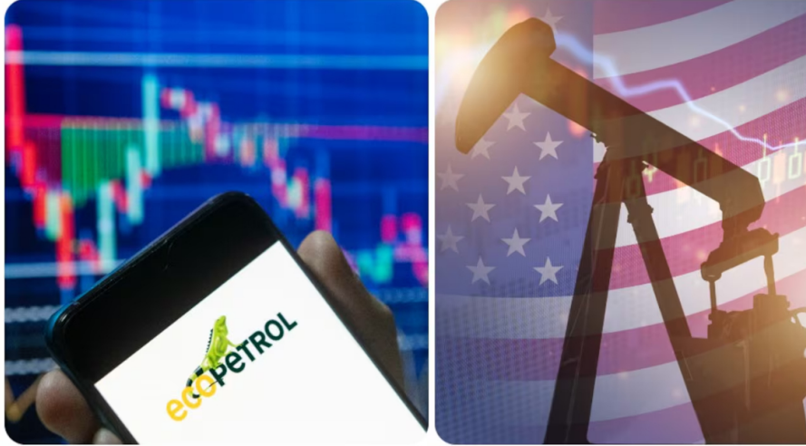
La acción de Ecopetrol en Estados Unidos tuvo un agosto negro.

El ADR de Ecopetrol, la acción de la petrolera que se transa en el mercado de Estados Unidos, tuvo un 'agosto negro', al tocar sus niveles más bajos en lo que va del año. El pasado 4 de agosto, llegó a su mínimo en 2024, con un valor de 9,72 dólares y el pasado 30 de agosto alcanzó los 9,84 dólares. A lo largo de este año la acción ha caído 17,45 por ciento. Su punto más alto fue el 3 de abril, cuando llegó a 12,89 dólares.