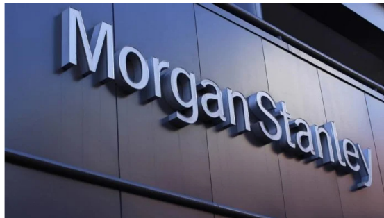
Morgan Stanley sube recomendación sobre Petrobras y mantiene a Ecopetrol fuera de sus favoritas.

El banco de inversión estadounidense Morgan Stanley reportó su más reciente informe de petróleo y gas en el que analizó a las más importantes empresas del sector en América Latina destacando las buenas perspectivas de la petrolera brasileña Petrobras y manteniendo por fuera de sus favoritas a Ecopetrol.