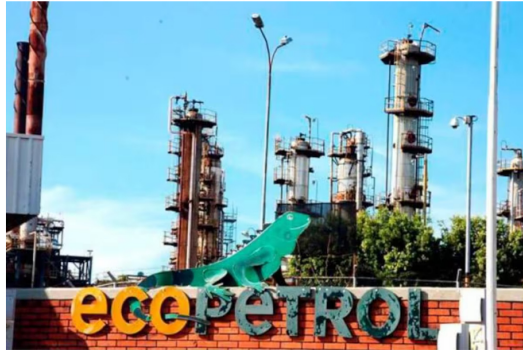
Las empresas que prestarán para los próximos 5 años el servicio de transporte aéreo de helicópteros para el Grupo Ecopetrol son Helicópteros Nacionales de Colombia S.A.S. (Helicol) y Helistar S.A.S.

El proceso contó con el acompañamiento de la Procuraduría General de la Nación y la Superintendencia de Industria y Comercio.