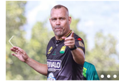
FÚTBOL COLOMBIANO Rafael Dudamel reconoció que Atlético Bucaramanga quedó en una situación "límite" luego de perder contra Tolima