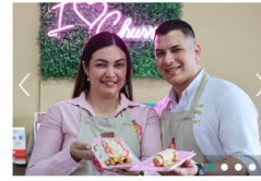
JUNTOS SOMOS MÁS Master Churros Bga: el éxito de una pareja migrante en Bucaramanga, Colombia