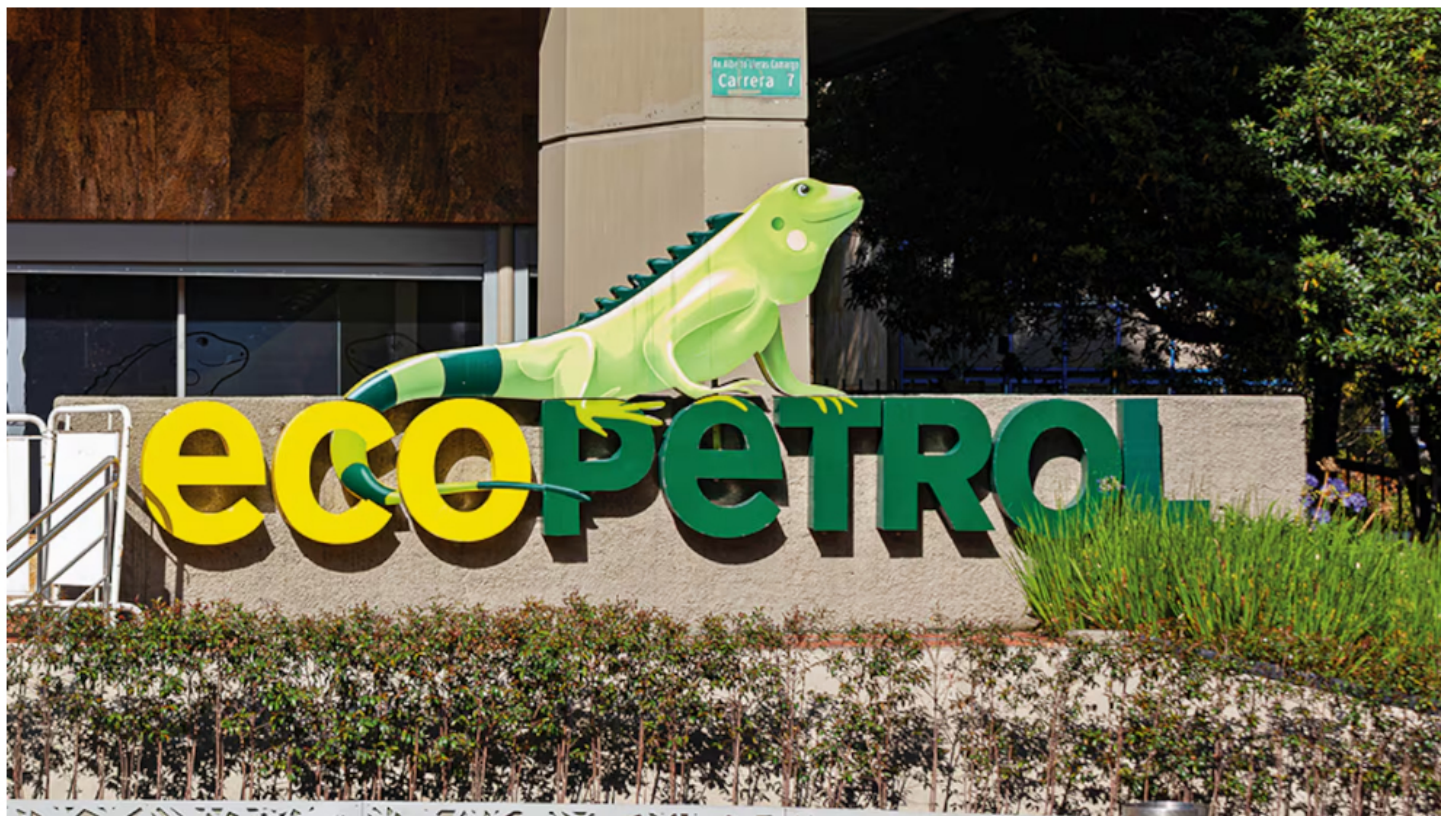
La compañía en la que la Nación tiene la mayoría de la propiedad accionaria lleva más de un año entre controversias por múltiples causas.