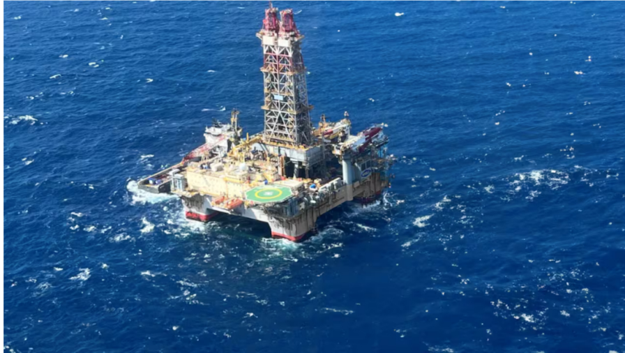
Uchuva 2

El Ministerio del Interior y la Dirección de la Autoridad Nacional tienen un mes para realizar una consulta previa con las comunidades indígenas de Taganga, que están en el departamento del Magdalena que se verían afectadas con la exploración y explotación del pozo Uchuva 2.