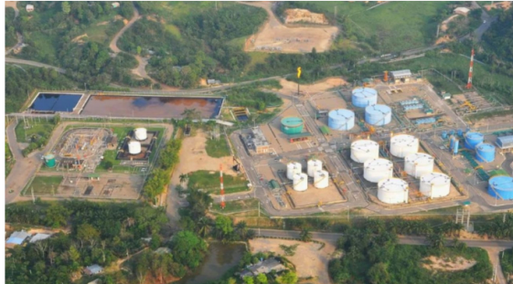
Se registró un atentado contra la infraestructura petrolera de Ecopetrol en el sector de la Carrilera, en Barrancabermeja Ecopetrol

Publicado: Miércoles, Octubre 30, 2024 - 09:57 | Actualizado: Miércoles, Octubre 30, 2024 - 09:57