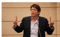
Miguel Uribe anuncia su precandidatura presidencial con respaldo estratégico de Lester Toledo