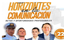
Unipaz organiza seminario sobre los desafíos del futuro de la comunicación