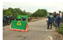
Trabajadores del sector petrolero protestan por mejores condiciones laborales