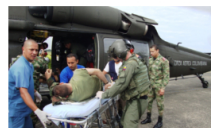
Los soldados heridos por minas antipersonales en Bolívar, uno sufrió amputación