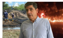
Autoridades refuerzan seguridad en el corregimiento El Centro tras atentado en oleoducto