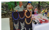
Feria social en Puerto Parra impulsa a emprendedores y víctimas del conflicto