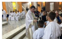
Nuncio apostólico preside celebración por aniversario de la diócesis de Barrancabermeja