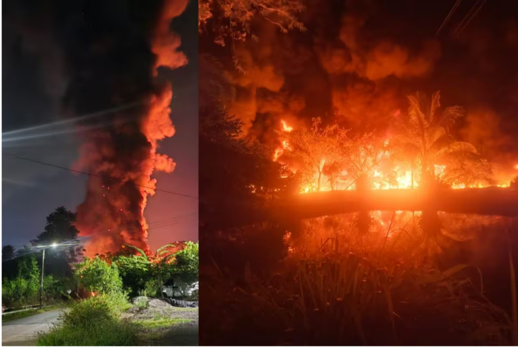
La explosión ocurrió en la madrugada de este miércoles 30 de octubre.

Varias familias evacuaron sus viviendas, que estaban ubicadas cerca del lugar donde se produjo la explosión. Ecopetrol se pronunció al respecto.