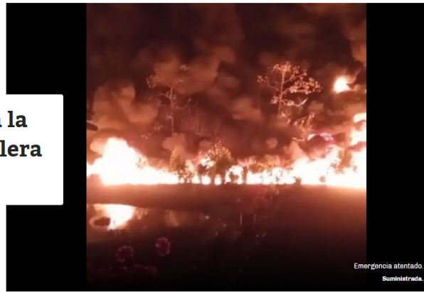
Emergencia atentado.