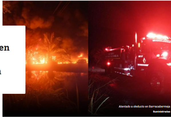
Atentado a oleoducto en Barrancabermeja

Por: Juan David Quijano Castillo @juanquijano08