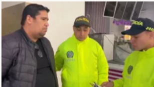
Video: Capturado explotador sexual de menores en entornos escolares de Bogotá