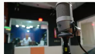
Primera emisora radial al aire en el mundo con locutores y programación solo con inteligencia artificial