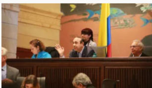
Presupuesto de regalías para 2025-2026 pasó su primer debate