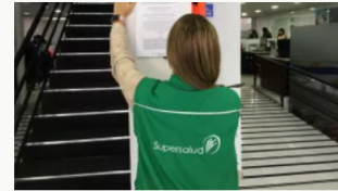
Supersalud denuncia posible red de corrupción en cuatro EPS