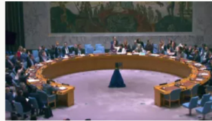
Consejo de Seguridad de la ONU renueva su Misión de Verificación en Colombia