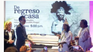
Alemania devuelve a Colombia piezas del pueblo Kogui tras más de un siglo en Berlín