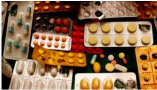
Consejo de Estado revoca medida para enfrentar desabastecimiento de medicamentos