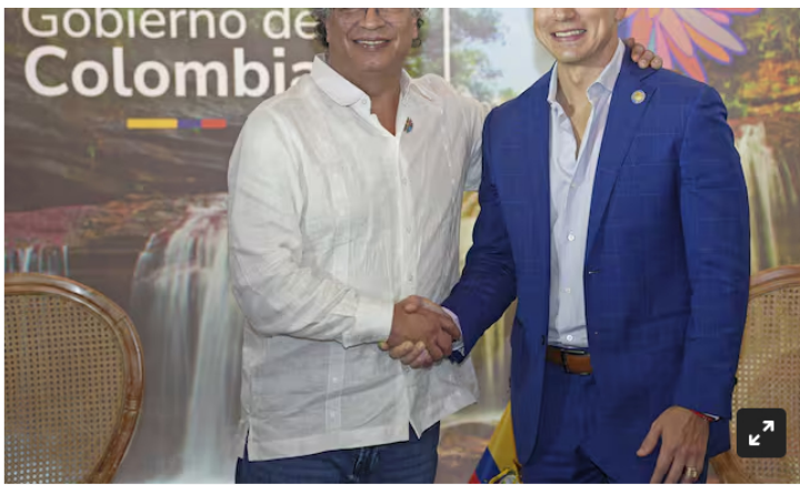
Fotografía cedida por la oficina de prensa de la presidencia de Colombia del mandatario Gustavo Petro (I) saludando al presidente de Ecuador Daniel Noboa, durante la conferencia de la ONU sobre Biodiversidad Biológica (COP16) este martes en Cali (Colombia). Los presidentes de Ecuador, Daniel Noboa, y Colombia, Gustavo Petro, mantuvieron este martes una reunión bilateral en la ciudad de Cali en la que hablaron sobre cooperación energética, en medio de la crisis que vive el país vecino, y fijaron un encuentro próximo en las Islas Galápagos.