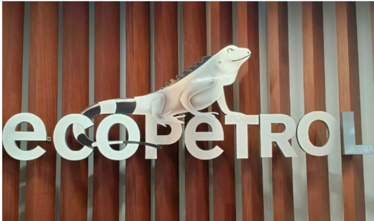
Ecopetrol /Foto: Rodrigo Torres, Valora Analitik

Entre las otras causas que llevaron a la no importación de gas a Colombia, Ecopetrol informó que la decisión se toma gracias a que la compañía logró una optimización de los propios consumos de la firma.