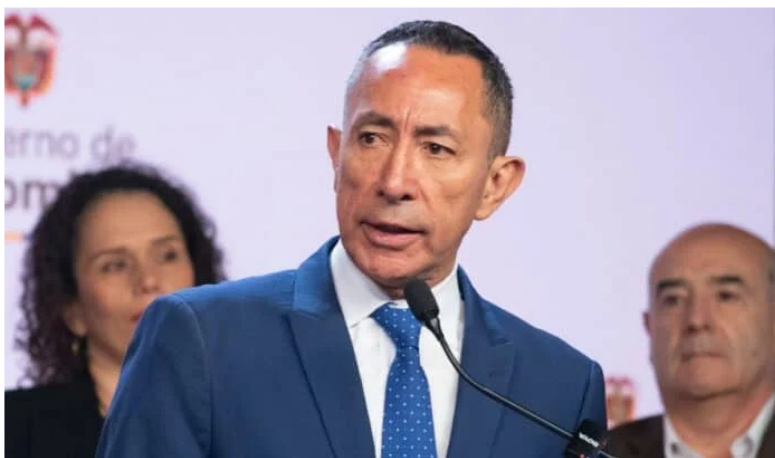
Ecopetrol restringió suministro de gas vehicular en Colombia para dar prioridad a térmicas.