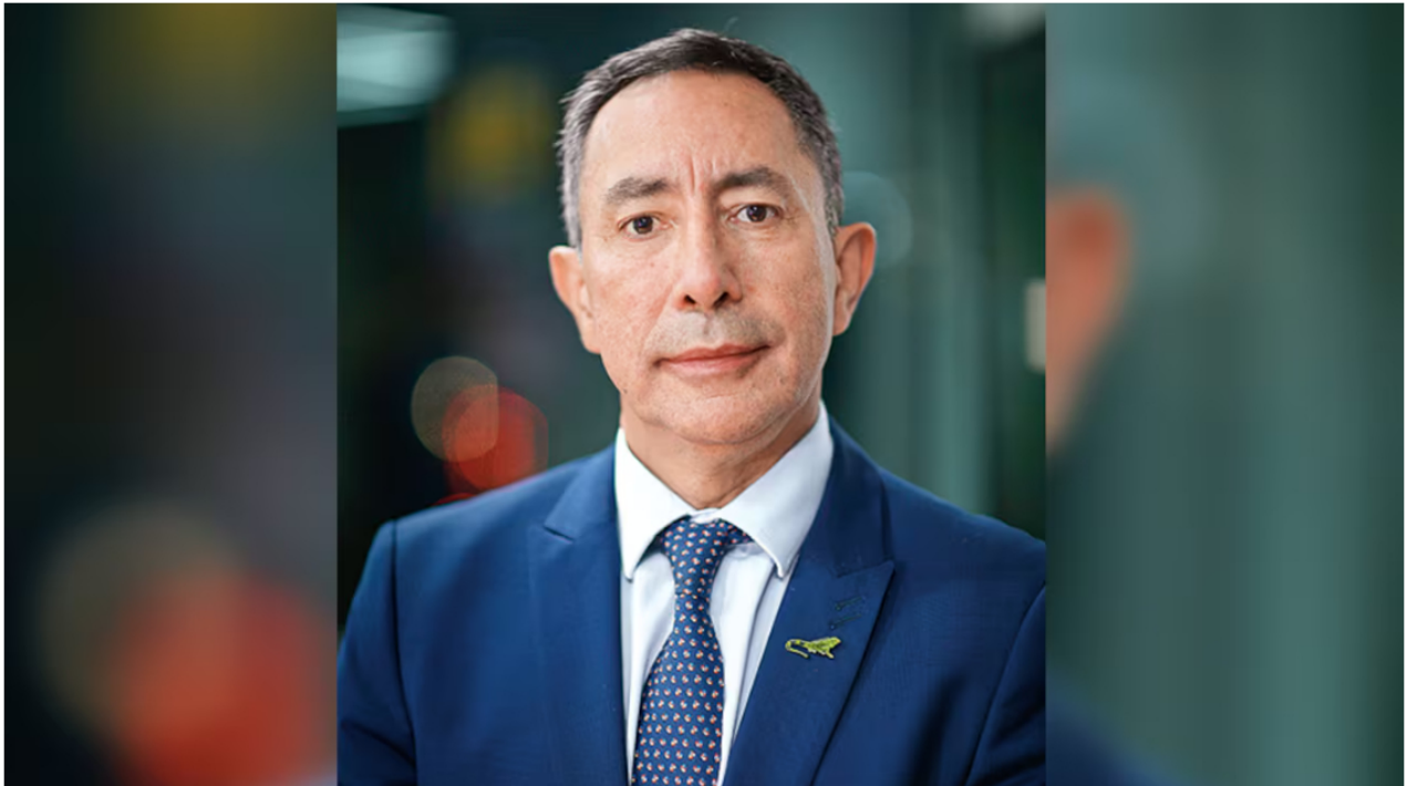
Ricardo Roa, presidente de Ecopetrol , ha insistido en la posibilidad de importar gas de Venezuela, pese a las restricciones estadounidenses.