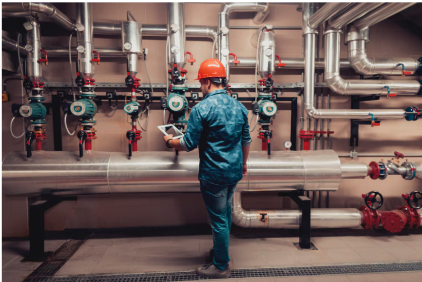
Gas natural | Foto: Getty Images

Con el ahorro aplicado, de acuerdo con lo mencionado por Roa, Ecopetrol pasó de utilizar 256 GBTU día a 200 o 210 GBTU día, señaló.