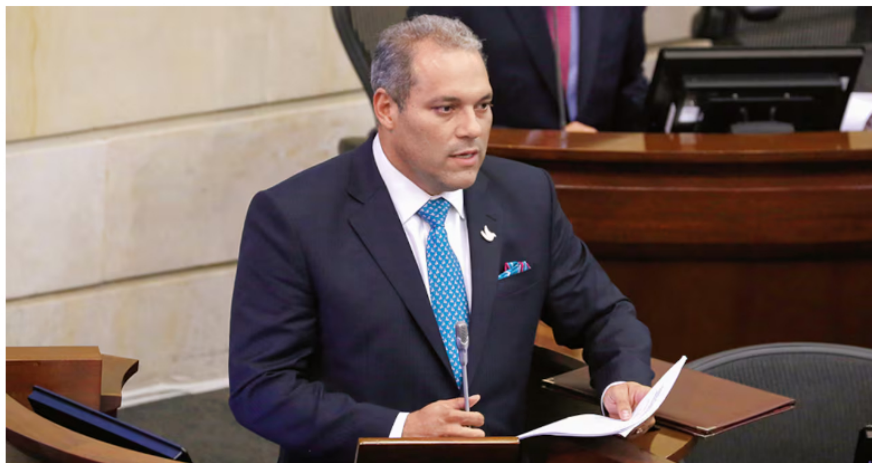
José David Name, senador.

siempre ha sido visto con buenos ojos. De hecho, entre las estadísticas presentadas por Name, se puso en el tapete el abultado incremento en el gasto financiero que ha tenido la empresa entre 2022 y 2023, mientras que variables claves, como las reservas de hidrocarburos cayeron de 8,4 a 7,6 años, dijo el parlamentario.