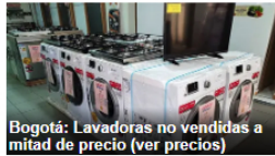
Bogotá: Lavadoras no vendidas a mitad de precio (ver precios)