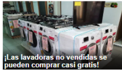
¡Las lavadoras no vendidas se pueden comprar casi gratis!