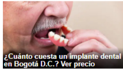
¿Cuánto cuesta un implante dental en Bogotá D.C.? Ver precio