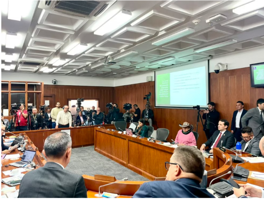
En el debate de control político al presidente de Ecopetrol , Ricardo Roa, se analizaron varios temas, entre ellos la caída de utilidades de la empresa y las decisiones tomadas sobre nuevos negocios fuera del país

"Ecopetrol", nada más y nada menos que en la Bolsa de New York, se ha caído, y ¿por qué?, Porque qué inversionista va a invertir en una empresa donde el presidente está diciendo que la va a acabar en Colombia ", manifestó.