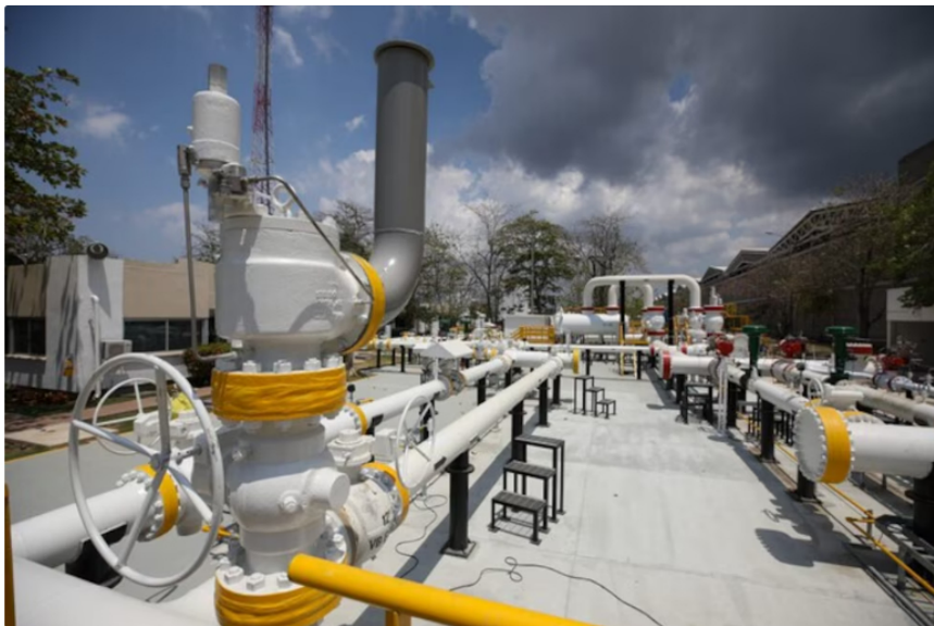
Colombia tendría reservas de gas para los próximos siete años

Mencionó que la infraestructura actual es suficiente para satisfacer la demanda energética sin recurrir a importaciones extras. “Respecto a la infraestructura existente para importar gas, la demanda y la capacidad de producción, no habrá necesidad de importar volúmenes de gas” , dijo.