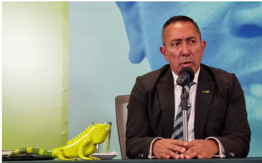
Ricardo Roa, presidente de Ecopetrol , es investigado por haber permitido que se violaran los toques de ingresos económicos en la campara presidencial de Gustavo Petro

Duras críticas y cuestionamientos recibió el presidente de Ecopetrol , Ricardo Roa, durante el debate de control político al que fue citado por la Comisión V del Senado de la República, que se hizo con el fin de analizar las caídas de utilidades, la importación de gas desde Estados Unidos, los resultados de las acciones y planes energéticos adoptados, entre otros.