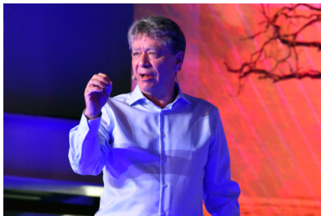
Bruce Mac Master señaló que la necesidad de importar gas natural que tiene el país tendrá diferentes efectos negativos en la economía .

Por su parte, el presidente de la Asociación Nacional de Empresarios de Colombia (ANDI), Bruce Mac Master, aseguró hace unas semanas que la necesidad que tendrá el país de importar gas natural para hogares y generación de energía es el resultado de la falta de planificación .