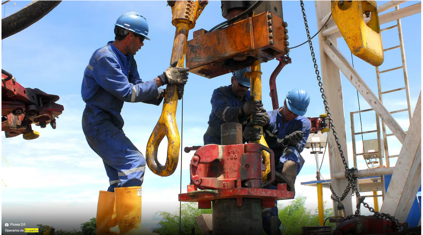
Picasa 2.0 Operarios de Ecopetrol.