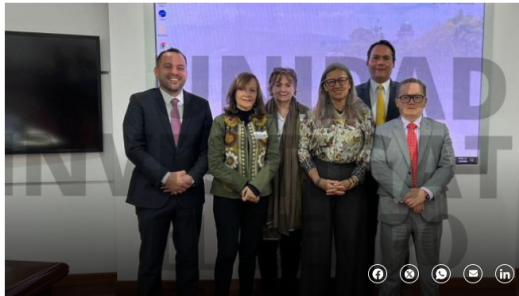
Nueva junta de Ecopetrol.

Según el oficio, se ordena la indagación previa "a fin de obtener las pruebas que permitan delimitar los hechos enrostrados y proceder a valorarlos de cara a la posible incidencia disciplinaria".