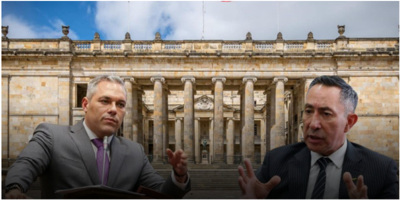
El senador José Name, de 'la U', pidió investigar a Ricardo Roa, presidente de Ecopetrol.

La queja fue interpuesta por la comisión quinta del Senado. Se menciona la caída de utilidades y a la junta directiva.