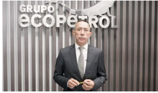
La Procuraduría busca establecer si el comportamiento de Roa refleja una omisión en el cumplimiento de sus deberes.

Este organismo examinará si las ausencias reiteradas del Presidente de Ecopetrol constituyen una falta disciplinaria que amerite sanción.