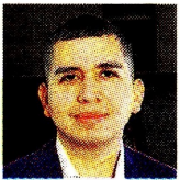
JONATHAN MALAGÓN Presidente de Asobancaria @JoMalagon

La llegada de la pandemia transformó de manera definitiva la forma en que los colombianos realizan sus transacciones diarias. La banca colombiana enfrentó en 2020 el reto de facilitar los pagos con el menor contacto posible, desencadenando un proceso de transformación digital e inclusión financiera sin precedentes. Lo que alguna vez fue un sueño hoy es realidad: en dicho año, 45,7% de los colombianos tenía acceso a un depósito de bajo monto (también conocido como cuenta/billetera digital), mientras que actualmente 72,1% de la población cuenta con una de estas cuentas, lo que se traduce en un avance significativo en la inclusión financiera, que en 2023 se ubicó en el 94% de los adultos.