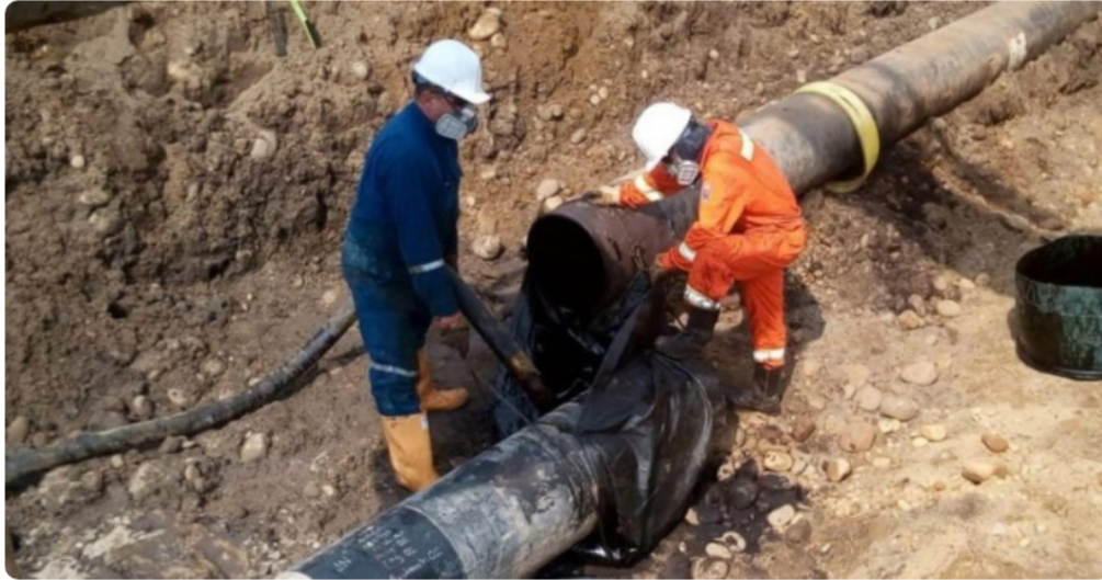
Cuatro trabajadores de Cenit, filial de Ecopetrol fueron secuestrados mientras se dirigían a reparar el oleoducto Caño limón - Coveñas