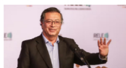
Imagen positiva de Petro sube al 54%, según encuesta pasada

Acuerdo entre Sura y Argos: camino hacia la independencia