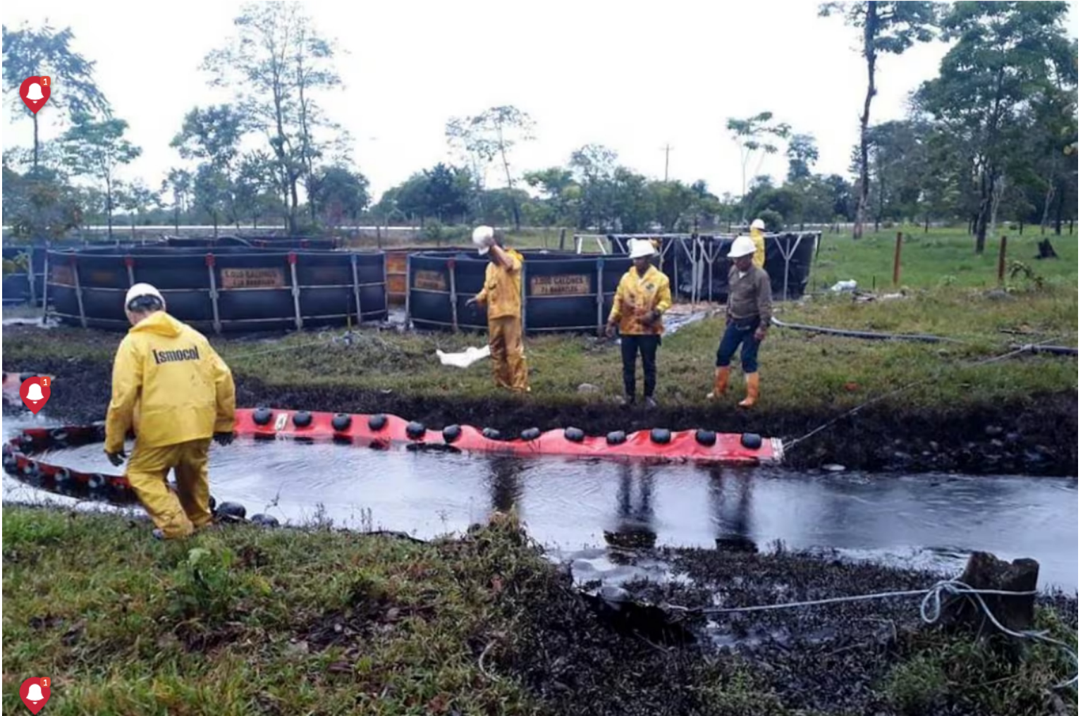
Se produjo un secuestro cuando trabajadores se dirigían a realizar trabajos en el oleoducto de Caño Limón.

Los trabajadores se dirigían a realizar trabajos en el oleoducto de Caño Limón cuando ocurrió el secuestro. Conozca los detalles aquí.