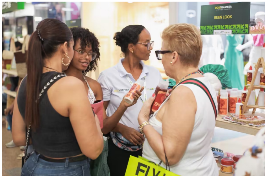
102 emprendimientos participaron en la feria.