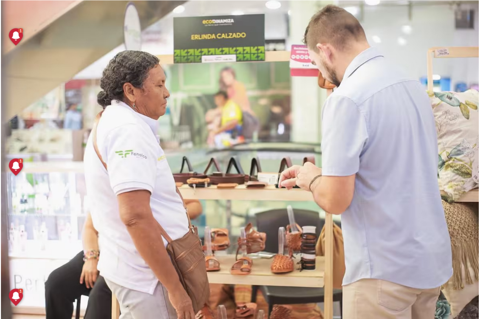
La feria se realizó en el Centro Comercial Caribe Plaza.

La feria fue organizada por Ecopetrol , Fenalco Bolívar y la Alcaldía de Cartagena, con el fin de promover el crecimiento de los emprendedores de la ciudad.