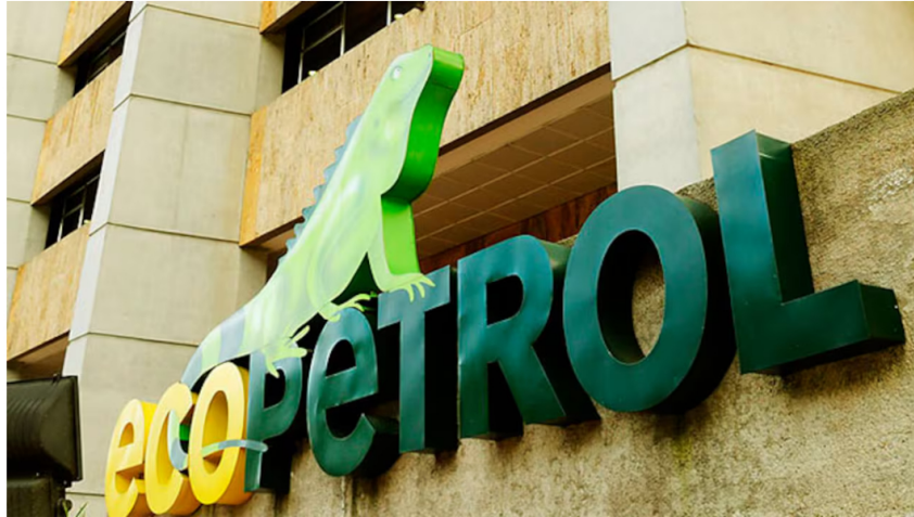
Ecopetrol no se ha pronunciado sobre este reporte.

25 de octubre de 2024 Por: Redacción El País