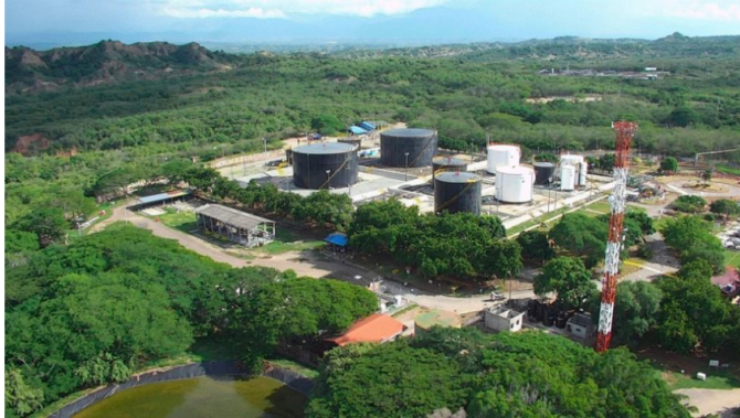
Campo petrolero Dina-Terciarios, ubicado en el municipio de Neiva, departamento del Huila.

En desarrollo de la estrategia 'Ecopetrol 2040: Energía que Transforma', el Grupo Ecopetrol anunció una inversión progresiva en los próximos seis años en el departamento del Huila hasta por 512 millones de dólares, para desarrollar el proyecto integrado de los campos Dina-Terciarios y Palogrande, ubicados en los municipios de Neiva y Aipe, de esa sección del país.