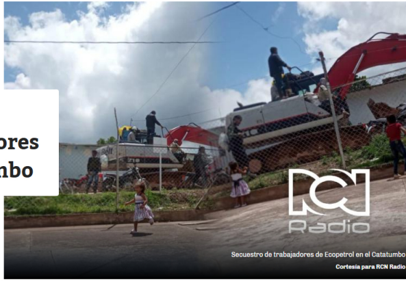
Secuestro de trabajadores de Ecopetrol en el Catatumbo